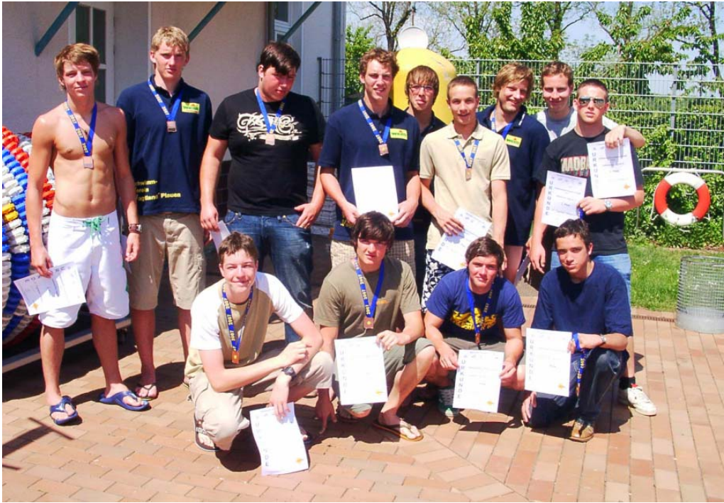
Mannschaft des SVV Plauen nach dem Gewinn der Bronzemedaille

Ostdeutscher Meister wurde Wasserfreunde Spandau 04 durch einen 14:12 Sieg gegen OSC Potsdam. Der SC Magdeburg wurde Fünfter vor VfL Gera.